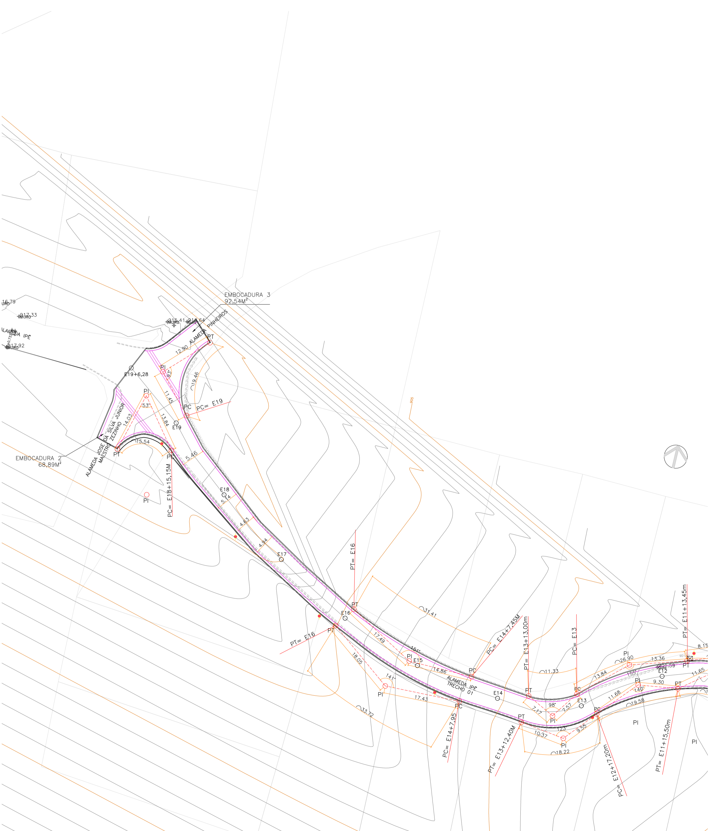
PLANTA - GEOMÉTRICO Escala 12 à estação 19 + 6,28m