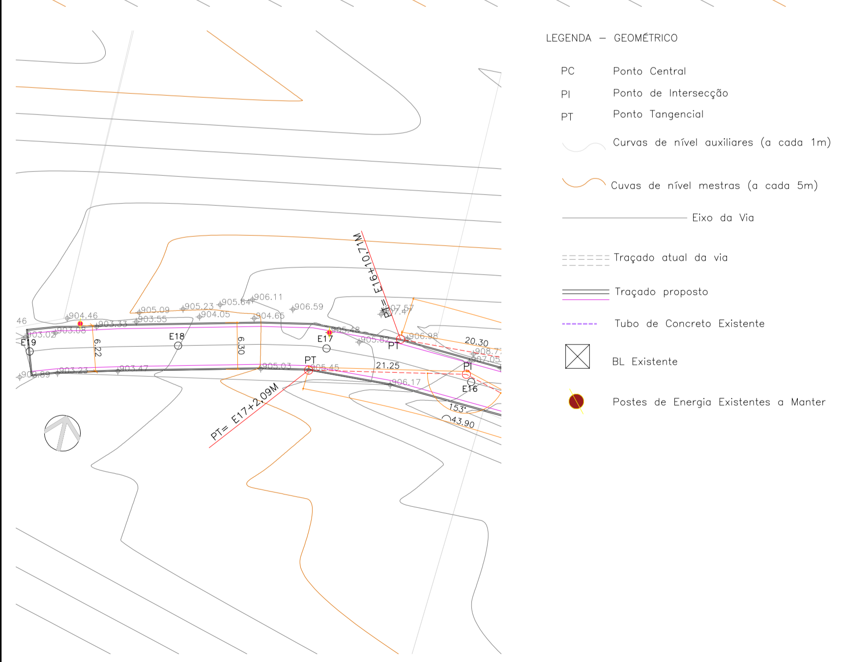
PLANTA - GEOMÉTRICO Estaca 17 à estaca 19